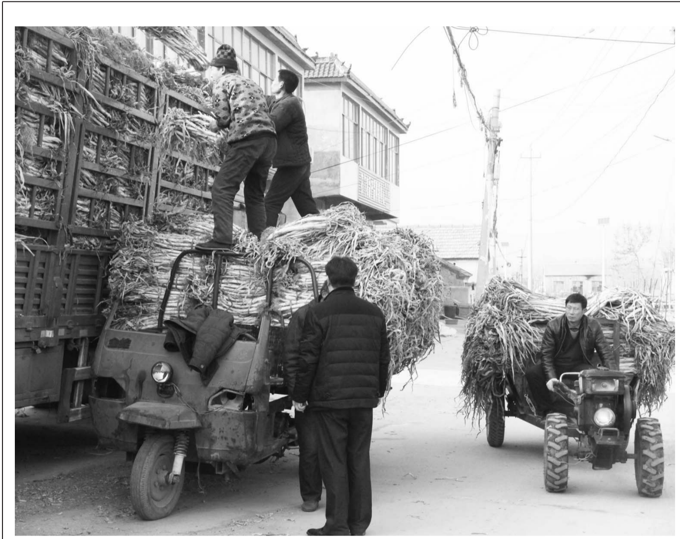
□孙涛 报道 日前, 记者在泗水镇石门村看到, 该村菜农正在装运刚刚收购到的大蒜。石门村水资源丰富, 村里有种植大蒜的传统, 2015年种植的近百亩大蒜喜获丰收。目前临近春节, 大蒜在市场上走俏, 每公斤涨价至5.6元左右, 该村所产大蒜不仅在当地及周边地区销售, 也销往河南、上海等地。

精准制定到户脱贫方案。根据精准识别结果, 为每一个贫困户量身定做脱贫方案, 在方案制定上, 始终坚持做到“两明一实”, 即致贫原因明、农户愿望明、帮扶措施实。对精准识别的扶贫对象, 以问题和需求为导向, 逐户进行认真分析, 找准贫困病根, 开出治贫良方, 实行一户一策, 确保户户都有帮扶责任人, 户户都有脱贫方案。在制定脱贫方案前, 采取副科级以上干部包村、联户干部包户的方式, 逐村逐户分析原因, 征求意见, 制定方案, 张榜公示, 确保措施精准, 方案精准。对张榜公示后的脱